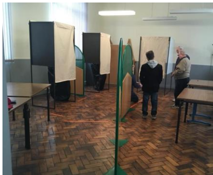
Election le 15 mars, du nouveau Conseil Municipal de Guerville.