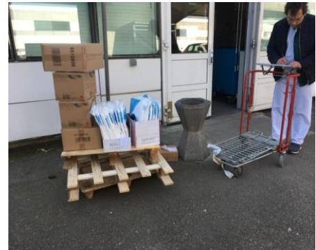
Face au COVID-19, la Mairie fait un don de matériels à l'hôpital de Mantes la Jolie.