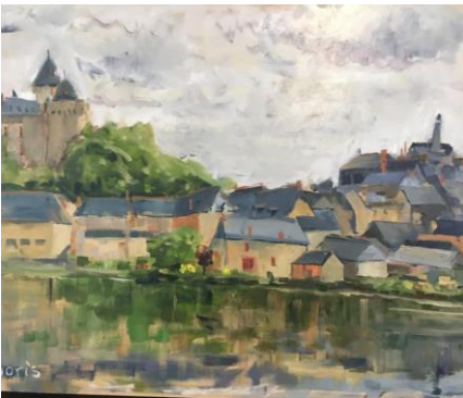
Exposition des œuvres de Boris GARANGER.