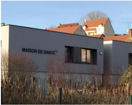
Ouverture de la Maison de Santé de Guerville.