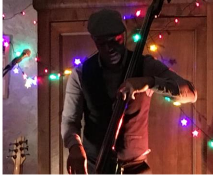
Concert du groupe C'estADire pour la Nuit de la Lecture à la Bibliothèque.