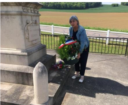
Célébration de l'Armistice au monument aux Morts.