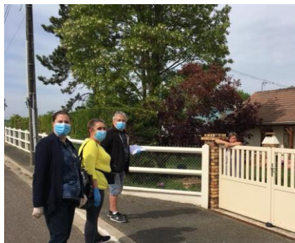
Distribution de masques par la Municipalité avant le déconfinement.