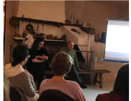
Apéro-Ciné à la Bibliothèque l'Embellie.