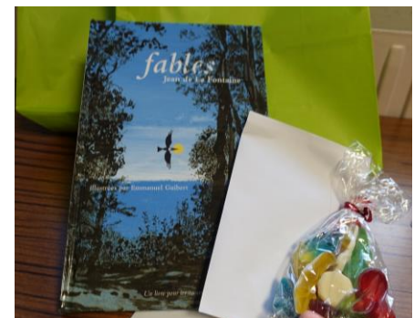
Cadeaux offerts aux CM2 afin de marquer leur entrée au collège.