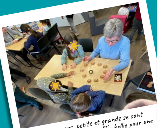
Mercredi 6 mars, petits et grands se sont retrouvés à la bibliothèque l'Embellie pour une nouvelle édition du Temps du Lude.