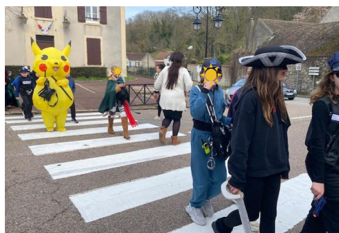
Carnaval de l'école vendredi 8 mars : les enfants ont défilé dans la commune avec leurs tenues toutes plus originales les unes que les autres.