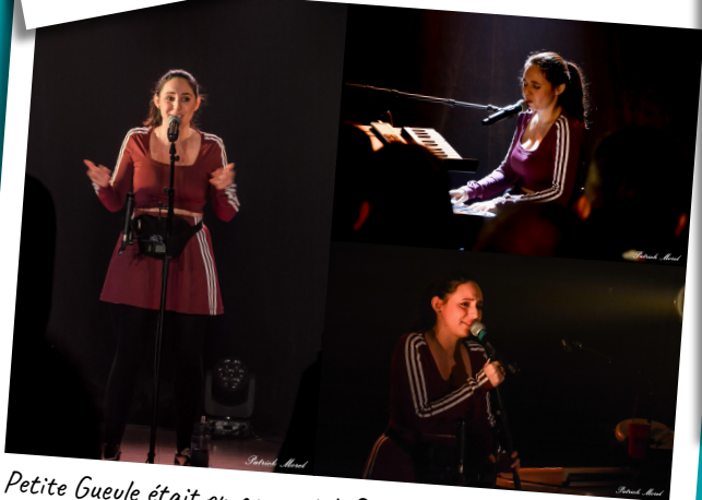
Petite Gueule était en concert à Guerville le 1er mars, où elle a livré ses textes plein de fougue, de sensibilité et d'auto-dérision. Un bien joli moment.