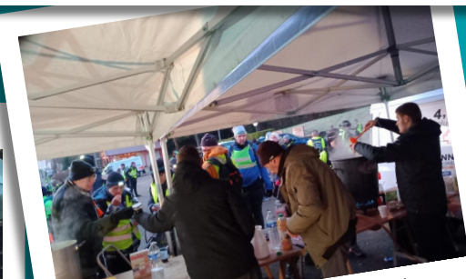
Les bénévoles de L'Entente Senneilloise étaient au rendez-vous pour l'accueil des coureurs du Paris-Mantes fin janvier.