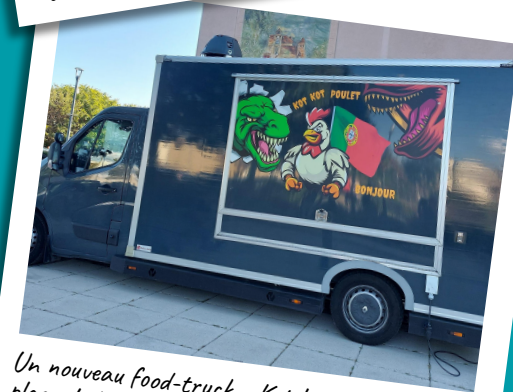
Un nouveau food-truck... Kot Kot Poulet, sur la place de la Mairie de Guerville, les jeudis soirs des semaines impaires.