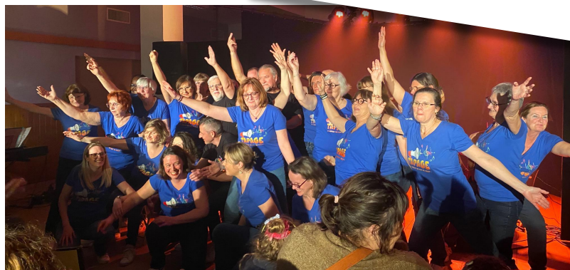
La chorale "Tapage" de Brevil-Bois-Robert a assuré la 1 re partie du concert de Petite Gueule avec tout son dynamisme et sa bonne humeur habituels !