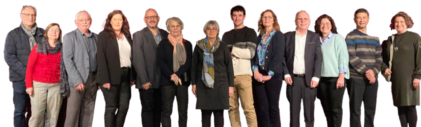
Votre équipe municipale