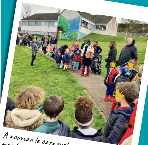
A nouveau le carnaval : pas facile avec les manteaux !