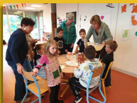
Atelier cuisine avec les enfants de l'ALSH