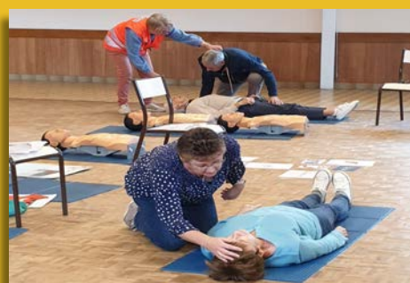
Formation aux gestes qui sauvent.

Du 7 au 12 octobre, dans le cadre de la Semaine Bleue, les aînés de Guerville ont été mis à l'honneur à travers un programme riche et varié. L'occasion de reconnaître la contribution des seniors à notre société et de lutter contre les préjugés liés au vieillissement.