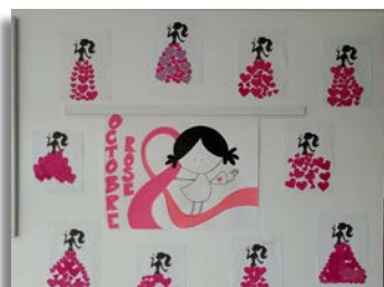
Créations des enfants