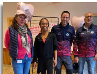
FBI Klub et GTR