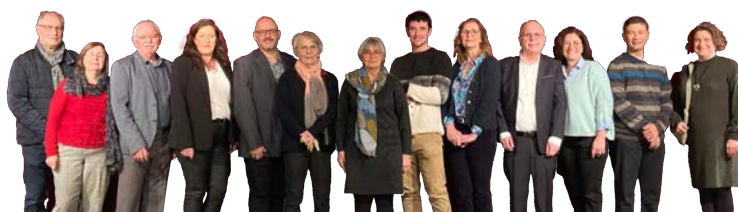
Votre équipe municipale