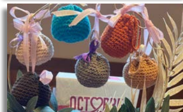
Ventes du coeur