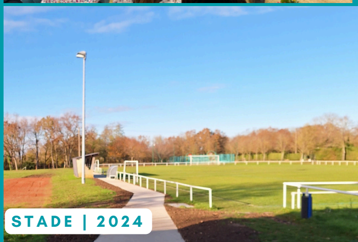
STADE | 2024