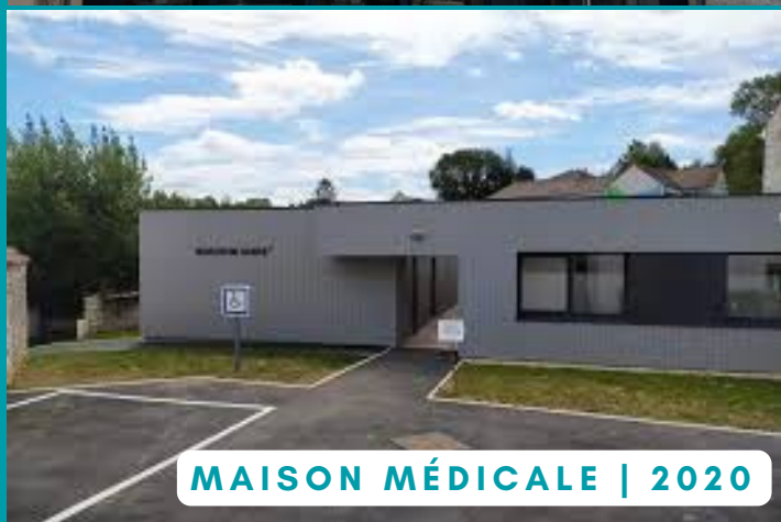
MAISON MÉDICALE | 2020