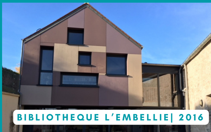
BIBLIOTHEQUE L'EMBELLIE | 2016