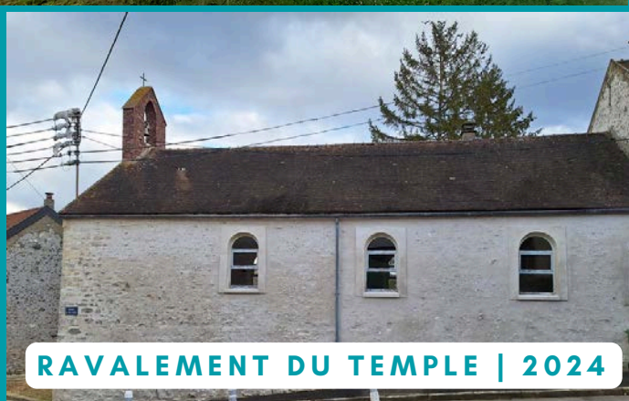
RAVALEMENT DU TEMPLE | 2024