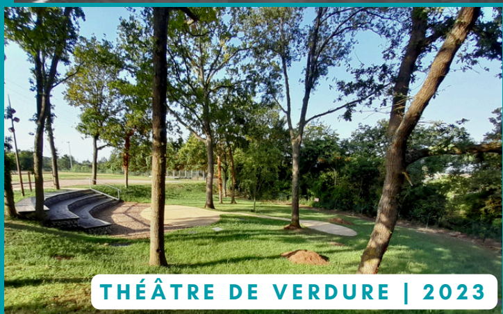
THÉÂTRE DE VERDURE | 2023