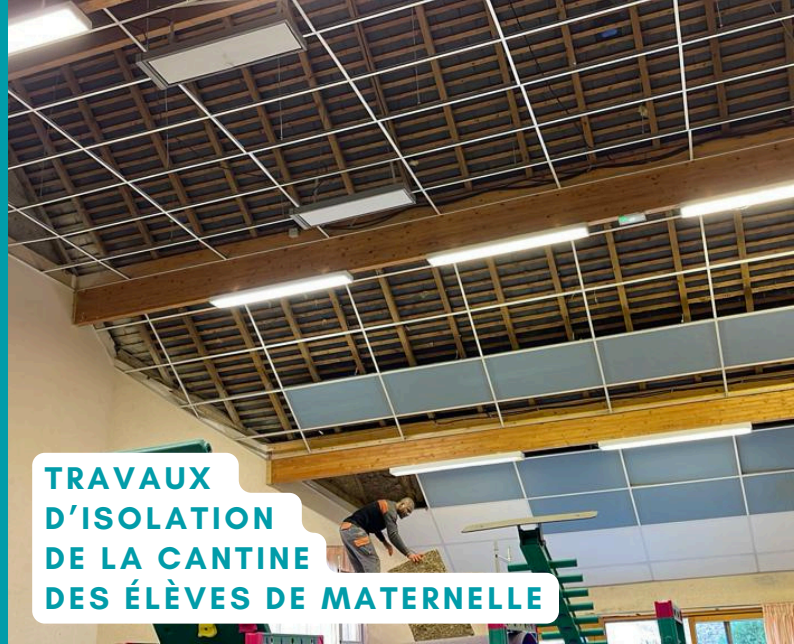
TRAVAUX D'ISOLATION DE LA CANTINE DES ÉLÈVES DE MATERNELLE

Toutes ces initiatives contribuent à améliorer le confort de nos enfants et du personnel qui travaille dans ces locaux.