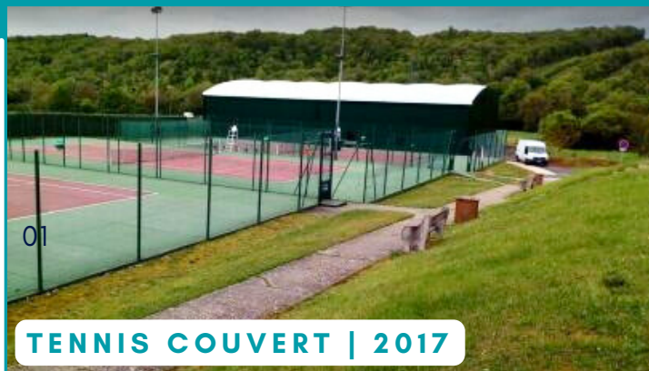
TENNIS COUVERT | 2017