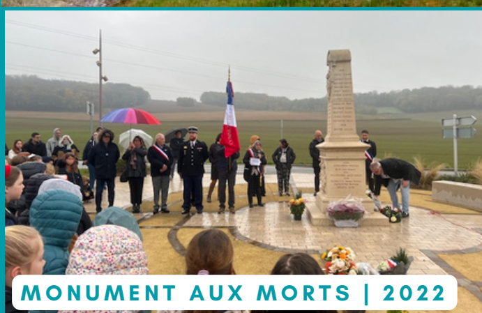
MONUMENT AUX MORTS | 2022