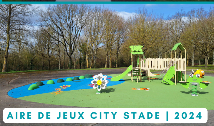
AIRE DE JEUX CITY STADE | 2024